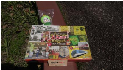
「元祖特撰牛肉弁当」 ¥3,000 以上の購入特典は 駅弁 140 周年のチケット

なお、¥3,000 以上お買い上げでプレミアム駅弁グッズプレゼントが ございます。