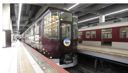
大阪上本町駅で撮影