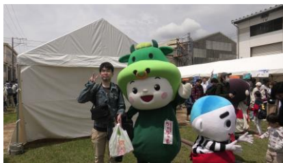
三重県松阪市のキャラクター 「ちやちやも」