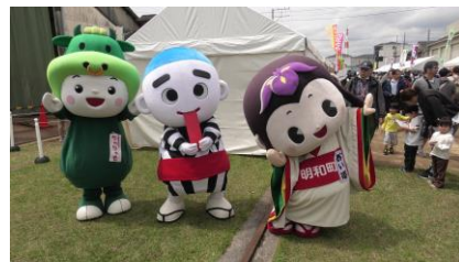
各市町のキャラクターの 3ショット