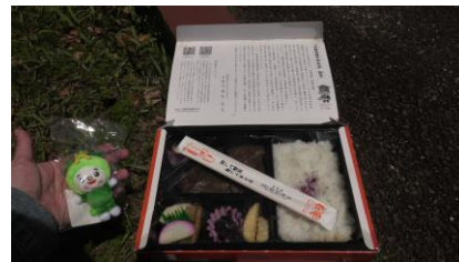
元祖特撰牛肉弁当 松阪市のキャラクター 「ちゃちゃも」と一緒に📷