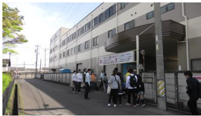
入り口付近の様子