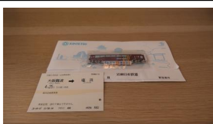
チケットと記念品