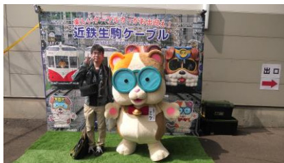
生駒ケーブルのキャラクター 「ミケ」