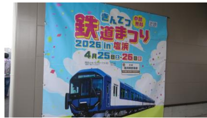
入り口付近の垂れ幕