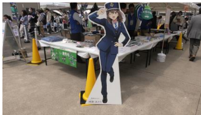
三重交通キャラクター 「神都あかり」