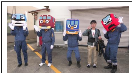
近鉄公式キャラクターと お写真を撮っていただきました。