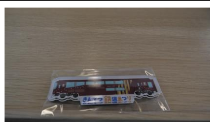
記念品はマグネットです。