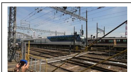
観光特急「しまかぜ」

しまかぜは近鉄四日市駅を平日は 10:53 に、土休日は 10:54 に発車します。 会場内では近鉄四日市駅到着と近鉄四日市駅発車のアナウンスが 流れていました。