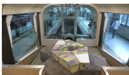
「楽 VISTA スポット」