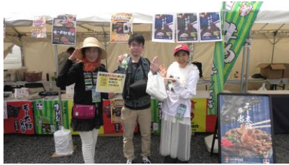
駅弁のあら竹 ぴー&みー

駅弁のあら竹のぴー&みー、三重県明和町・三重県松阪市・三重県四日市市の各市町のキャラクター、生駒ケーブルの「ミケ」とお写真を撮っていただきました。ありがとうございました。