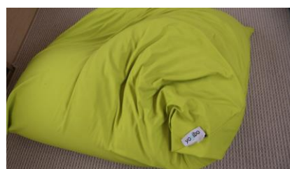
Yogibo のクッション (1号車)