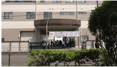
公園から見た、入り口付近