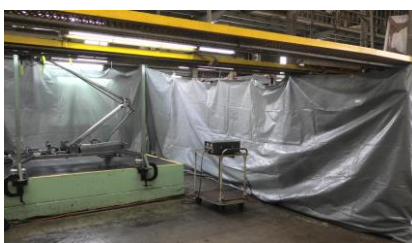
パンタグラフ体験

パンタグラフの操作ボタンを押下することにより、パンタグラフを上下させる体験です。