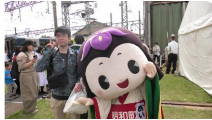
三重県明和町のキャラクター 「めい姫」