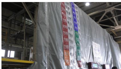
上から吊るされている方向幕