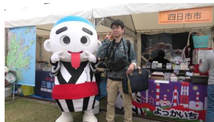
三重県四日市市のキャラクター 「こにゅうどうくん」