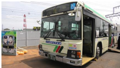
ノンステップバス