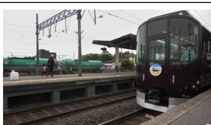
塩浜駅に停車中の「楽」

団体列車「楽」のツアーも楽しみの一つではありますが、本来の目的は「きんてつ鉄道まつり 2026 in 塩浜」への参加であるために、この後会場へと向かいます。